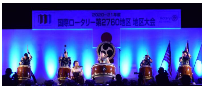
和太鼓ユニット光 - wadaiko unit KOH-