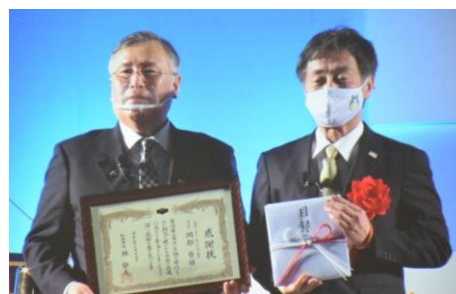
寄付目録贈呈 (知立市)