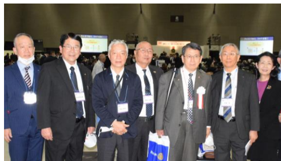
西尾 RC オンサイト参加メンバー