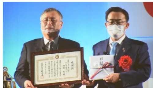
寄付目録贈呈 (愛知県)