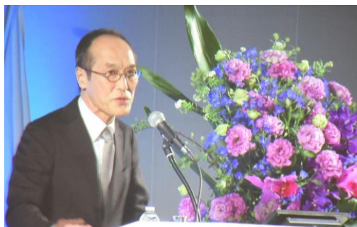
<講師> 東国原 英夫氏