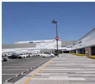
国際展示場 (Aichi sky EXPO)